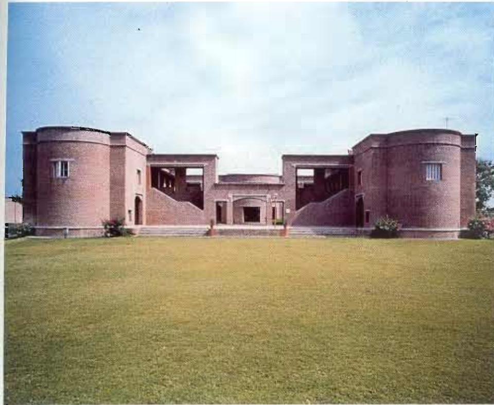
Fig. 4: dans l'Institut Indien pour le Développement de l'Entreprise, à Ahmedabad (Inde), l'architecte maîtrise avec bonheur les formes et les éléments de l'héritage indo-islamique. Fig. 5: le système de construction en pierres met en évidence une nouvelle manière de construire dans la province de Dar'a en Syrie. Ces deux constructions ont reçu la reconnaissance de la Fondation Aga Khan en 1992.